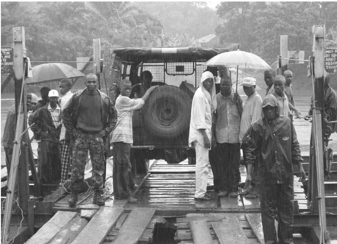
Demokratie buchstäblich im Regen: Die Wahlen sind frei und fair verlaufen. Doch was sich im Vorfeld abspielte, wird nicht gefragt. Überfahrt über einen Fluss zum Wahllokal.

Doch selbst wenn sie keiner physischen Gewalt ausgesetzt sind, werden strukturelle, finanzielle oder administrative Hindernisse in den Weg von Leuten ge-