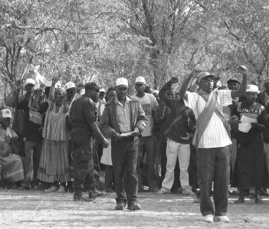
Wahlkampf auf angolisch.